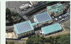
みんなの発電所 コミュニティソーラー