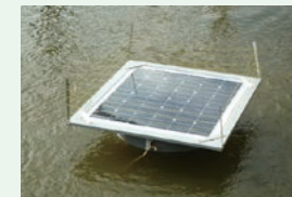
ソーラー水浄化装置